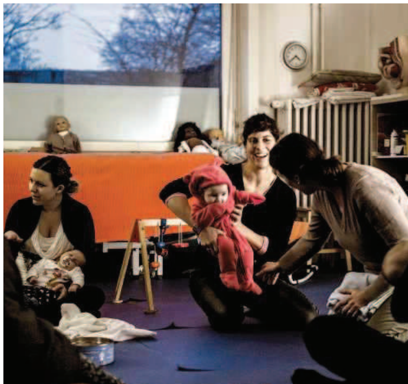
Grosse Freude an den Kleinen der anderen: Ja, es fühlt sich gut an, Göttin zu sein.

Der erste Eindruck ist gut, und ich bin emotional mittendrin. Das kleine Mädchen schläft auf dem Arm seiner Mutter, einer 20-jährigen Migrantin. Sie wohnt allein in einem einfachen Appartement und ist zurückhaltend, doch sie strahlt. Ihr Glück rührt mich zu Tränen. Alle Professionalität, die ich mir für diesen Tag zurecht gelegt hatte, ist wie weggewischt. Franziska lässt die Frau von ihrer Geburt erzählen, von den heftigen Schmerzen. Die junge Frau tut es ohne jegliche Scham, lässt sich dann den Uterus abtasten, zeigt ihre Brüste. Während ich die Kleine für das Wägen ausziehe, bespricht sie mit Franziska das Stillen. Sie pumpe jeweils ab, um zu sehen, wie viel die Kleine trinke. Tatsächlich: Sie